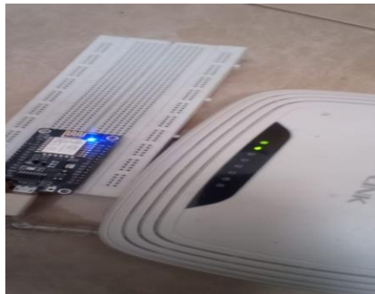
Gambar 2. Pengujian Tes Koneksi

Tes uji coba koneksi WiFi bertujuan untuk mengetahui apakah peralatan kita sudah bisa diakses atau tidak dengan menggunakan komputer atau smartphone . Pada tes ini menggunakan modul NodeMcu ESP8266 dan juga router TP-Link sebagai media penghubung ke jaringan internet. Tanda apakah aplikasi tersebut sudah bisa terhubung ke internet atau tidak dapat dilihat pada gambar 2.