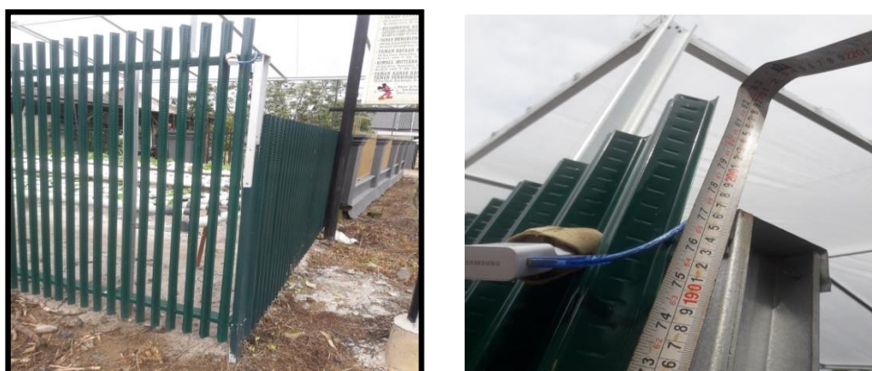
Gambar 2. (a) gambar pagar. (b) ketinggian pagar.

Berikut adalah gambar posisi peletakan modul pengirim pada pagar baja ringan.