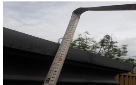
Gambar 4. (a) gambar pagar. (b) ketinggian pagar.

Dari hasil pengujian ke 2 atau skenario 2 di dapatkan hasil, bahwa jarak pengiriman dari modul 1 ke modul penerima dapat mengirim data dengan jarak pengiriman 290 meter, dan data yang dikirim dalam bentuk pembacaan kemiringan pada sensor mpu-6050. Pembacaan data sensor pada modul penerima dapat dilihat melalui Serial Monitor . Berikut adalah gambar jarak yang ditempuh pada sinyal pengirim data dalam bentuk google maps.