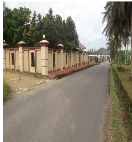
Gambar 3. (A). gambar di google maps. (B). gambar pada lapangan.

Pada skenario 2 dengan posisi diletakkan di atas pagar besi dengan ketinggian mencapai 1,95 meter. Modul yang diletakkan di atas pagar tersebut modul pengirim yang di mana fungsinya sebagai pengirim data sinyal dari modul 1 ke modul penerima dengan jarak yang akan diukur. Komponen yang digunakan yaitu nrf24l01 dengan sensor mpu-6050.