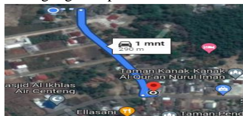
Gambar 5. Gambar pada google map.

Dari hasil pengujian ke 2 atau skenario 2 di dapatkan hasil, bahwa jarak pengiriman dari modul 1 ke modul penerima dapat mengirim data dengan jarak pengiriman 290 meter, dan data yang dikirim dalam bentuk pembacaan kemiringan pada sensor mpu-6050. Pembacaan data sensor pada modul penerima dapat dilihat melalui Serial Monitor . Berikut adalah gambar jarak yang ditempuh pada sinyal pengirim data dalam bentuk google maps.