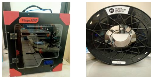
Gambar 2. 3D Printing Anycubic 4max dan Filamen Nylon

Untuk proses mencetak produk menggunakan mesin Anycubic 4max dengan printing volume XYZ 210mm x 210mm x 300mm jenis filamen yang digunakan adalah Nylon. Alat dan bahan ditunjukkan pada Gambar 2.