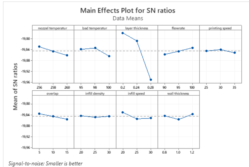
Gambar 4. Grafik S/N Ratio Panjang Produk