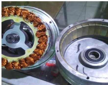
Gambar 3. Generator DC Magnet Permanent