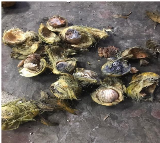
Gambar2. Hasil Dari Pengupasan Buah Pinang

Mesin pengupas buah pinang menggunakan sistem mekanik. Proses kerja dari alat pengupas buah pinang secara mekanik ini sendiri diantaranya, pertama rancangbangun alat pengupas buah pinang ini menggunakan motor bakar sebagai sumber tenaga penggerak untuk menggerakkan poros. Putaran dilakukan secara periodik untuk mendapatkan tenaga penggerak untuk memutar poros screw sebagai pembawa buah pinang menuju output dan sambil bertabrakan dengan mata potong yang diam disamping poros pembawa ( screw ). Cara mekanik ini diharapkan dapat membantu petani buah pinang sehingga pekerjaan lebih ringan dan mendapatkan hasil yang baik. Konsep rancangan mesin pengupas buah pinang dan hasil dari pengupasan buah pinang dapat di lihat pada Gambar 2 dan Gambar 3.