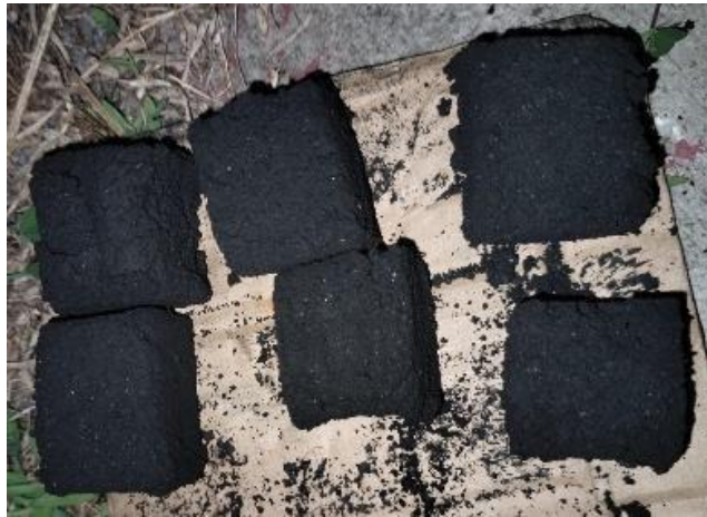
Gambar 3. Produk

Setelah melakukan uji coba dan melakukan analisa yang di dapat adalah pada perbandingan antar arang dan adonan kanji yaitu adonan arang tidak boleh melebihi jumlah adonan kanji karena kemungkinan adonan terlalu kering sehingga adonan kanji tidak bisa mengikat arang dan nantinya briket mudah pecah, juga sebaliknya jika adonan kanji lebih banyak jumlahnya dari bubuk arang ada kemungkinan adonan terlalu lembek dan mengembang pas dicetak.