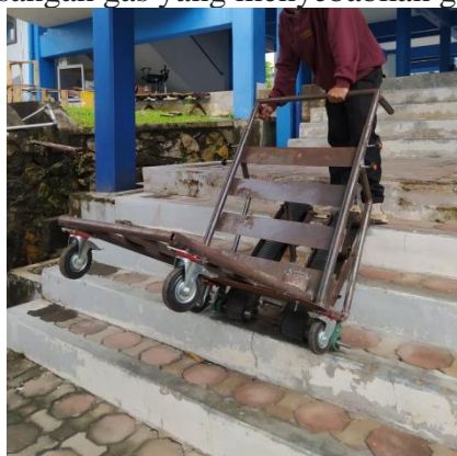
Gambar 2. Pengujian Alat