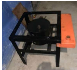
Gambar 2. Kompor Pembakaran Tempurung Kelapa

Kompor pembakaran tempurung kelapa menggunakan sistem pirolisis yang mana pembakarannya melalui oli bekas yang dapat ditemukan dengan mudah di bengkel-bengkel maupun hasil penggantian oli kendaraan pribadi. Serta dengan bantuan blower agar api menyala tahan lama untuk membakar tempurung kelapa. Tempat pembakaran maupun tempat penyimpanan tempurung kelapa menggunakan media pipa besi yang dipotong. Sistem rangka menggunakan profil besi L dengan dimensi yang tidak terlalu besar sehingga bisa disimpan dengan mudah yang perakitannya menggunakan metode pengelasan.