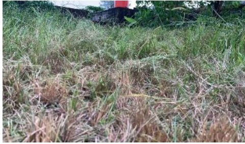
Gambar 2. Hasil Uji Coba Pertama

Pada pengujian pertama proses penebasan berhasil menebas semak belukar yang memiliki ketinggian rata-rata 30 cm menjadi 10 cm, dengan jarak 1 meter, kemudian terjadi masalah pada mesin, yaitu pada bagian pengencang belt terlepas pada saat pengoperasian.