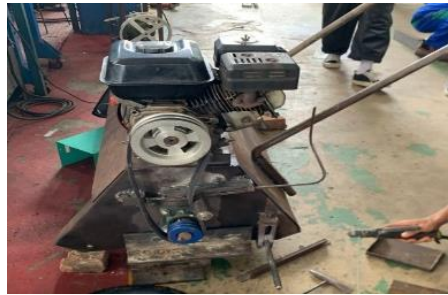
Gambar 3. Perbaikan Pengencang Belt

Pada pengujian pertama proses penebasan berhasil menebas semak belukar yang memiliki ketinggian rata-rata 30 cm menjadi 10 cm, dengan jarak 1 meter, kemudian terjadi masalah pada mesin, yaitu pada bagian pengencang belt terlepas pada saat pengoperasian.