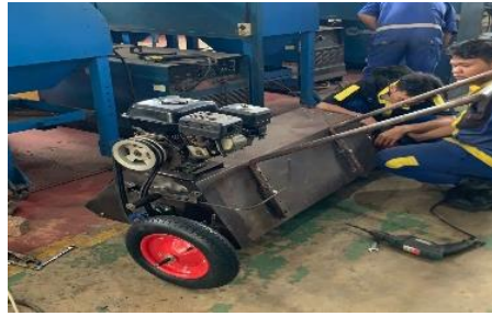
Gambar 5. Penggantian Belt

Masalah yang ditemukan pada saat pengujian kedua yaitu pada bagian pengencang belt terjadi slip sehingga solusi yang dilakukan yaitu menggantikan belt dari ukuran 42 menjadi 41.