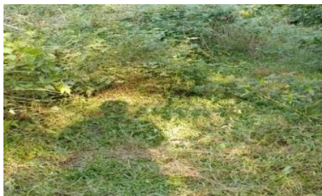
Gambar 4. Hasil Pengujian Kedua

Pada pengujian kedua mesin dapat menebas sepanjang 2 meter, kemudian terjadi masalah pada belt sehingga menyebabkan terjadi slip pada poros.