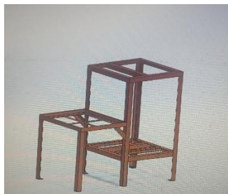
Gambar 2. Langkah Pembuatan OP

Langkah-langkah pembuatan OP rangka mesin adalah terdapat pada Gambar 2.