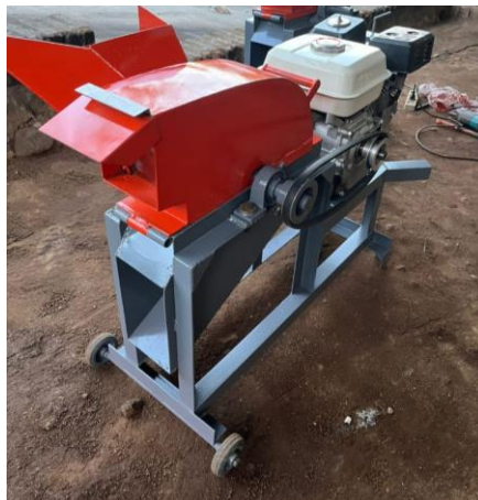
Gambar 2. Mesin Cocopeat

Setelah dilakukan proses pembuatan komponen, perakitan dan pengecatan dihasilkan prototipe mesin pencacah sabut kelapa menjadi serbuk kelapa ( cocopeat ) seperti ditunjukkan pada Gambar 2.