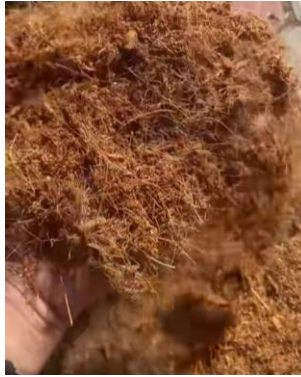
Gambar 3. Hasil Cacahan ( Cocopeat ).

Hasil uji coba dapat dilihat pada Gambar 3.